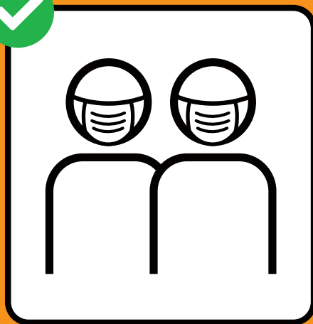
Usare la mascherina se non è possibile tenersi a distanza.