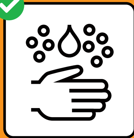
Lavarsi accuratamente le mani.