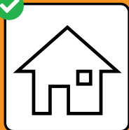
Per chi è positivo al test: isolamento. Per chi ha avuto contatti con una persona positiva al test: quarantena.