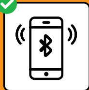
Per interrompere le catene di infezione: scaricare e attivare l'app SwissCovid.