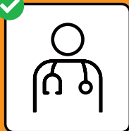
In caso di sintomi, fare immediatamente il test e restare a casa.