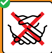
Evitare le strette di mano.