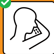
Tossire e starnutire in un fazzoletto o nella piega del gomito.